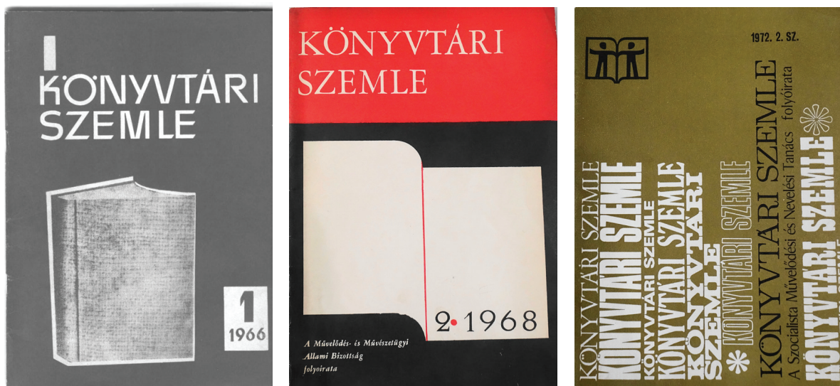
2. ábra Könyvtári Szemle

Beke György 21 szerint: „a Művelődés és a Könyvtári Szemle jó hagyományai közé tartozott könyvészeti összeállítások időnkénti közreadása; ezt közművelődési folyóiratunk, illetve ennek Könyvtár rovata folytatja, láthatóan a teljesebbre törekvés, nagyobb rendszeresség igényével.” 22