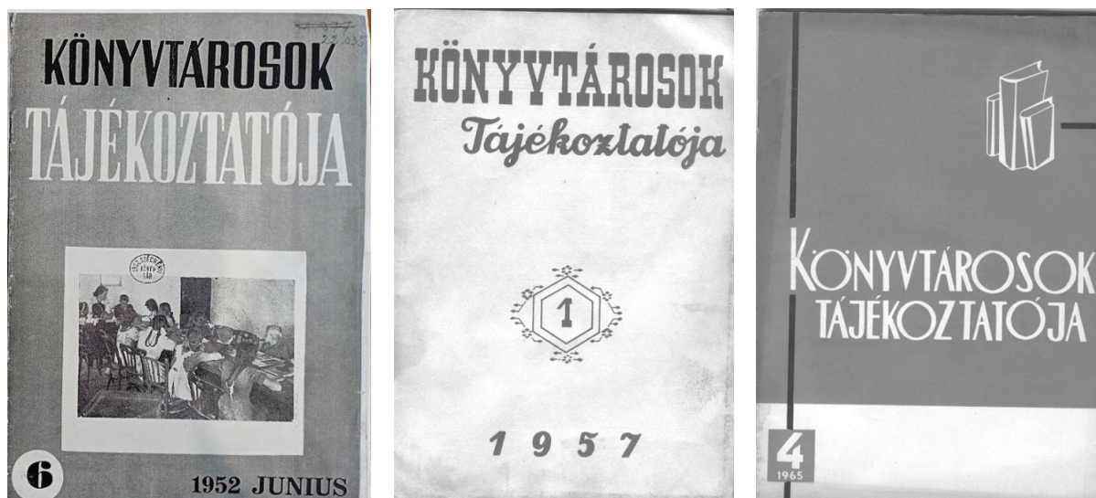
1. ábra Könyvtárosok Tájékoztatója

A román nyelvű könyvtári szaklap, a Călăuza Bibliotecarului 12 1966-tól Revista Bibliotecilor 13 név alatt jelenet meg. Társalap lévén, a Könyvtárosok Tájékoztatójának utóda a Könyvtári Szemle lett, amely szintén Bukarestben jelent meg 1966. jan./márc. (10. évf. 1. sz.) – 1973. okt./dec. (17. évf. 4. sz.) között. (2. ábra)