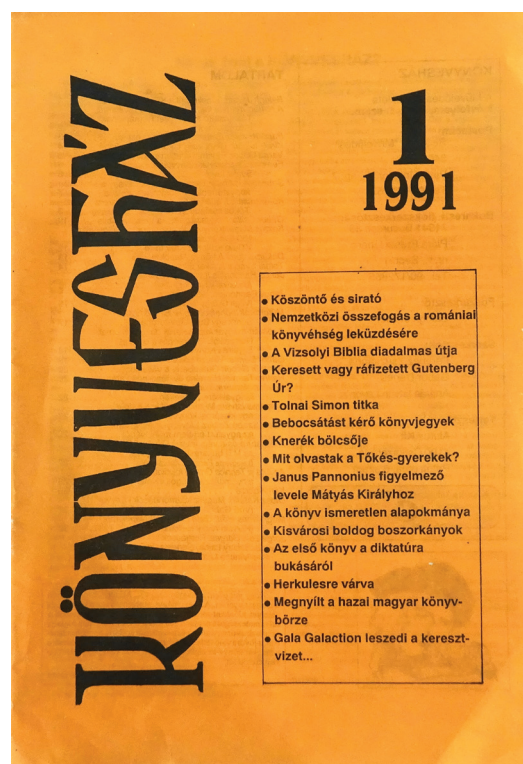
4. ábra Könyvesház, 1. kiadvány