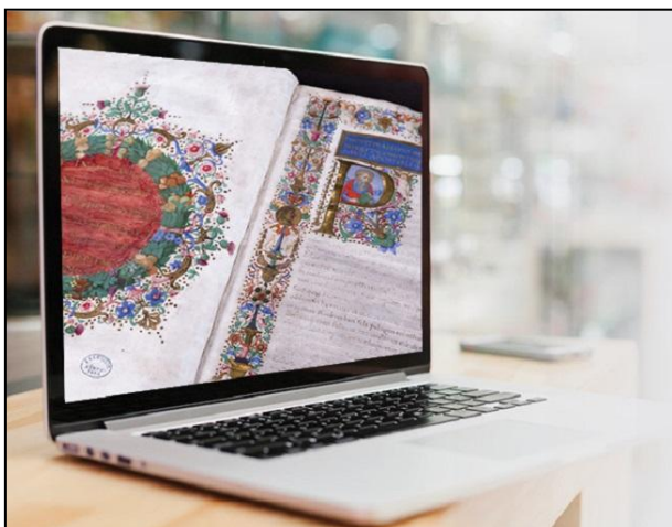
Múzeumi dokumentum digitalizálva

lag is adminisztrálható. Úgy működik tehát, mint az emberi szervezet. Minden szervnek saját feladata van, de a szervek egy rendszert alkotnak, és végül élő szervezetté állnak össze.